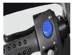
Kit cambio acelerador mano izquierda