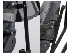
Soporte de bastones