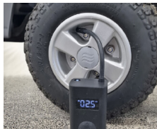
Compresor de aire