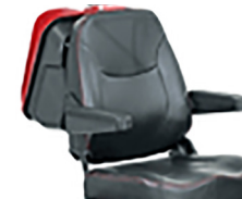
Asiento extra Ancho 56 ó 61 cm