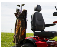
Soporte para bolsa de Golf