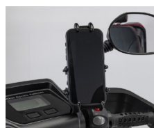
Soporte para teléfono móvil