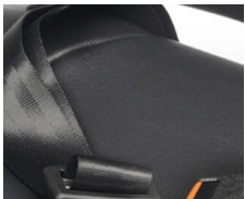
Cinturón de Seguridad