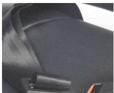
Cinturón de Seguridad