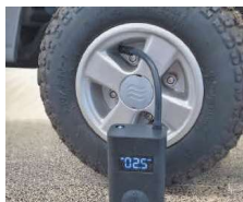
Compresor de aire