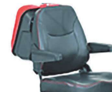
Asiento extra Ancho 56 ó 61 cm