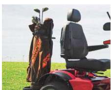
Soporte para bolsa de Golf