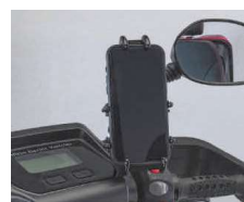
Soporte para teléfono móvil