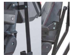
Soporte de bastones