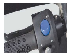
Kit cambio acelerador mano izquierda