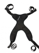
Arnés de tronco