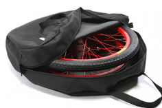
Bolsa para ruedas