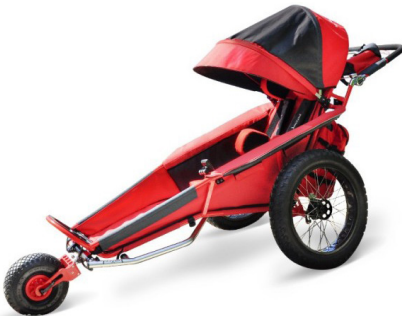
xROVER REHA BUGGY

Versión totalmente configurada para todo tipo de actividades de ocio al aire libre