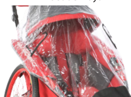
Protector de lluvia