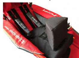
Cuña centra triangular