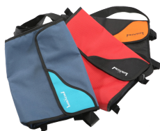
Bolsa de mano