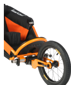
Jogging Set radios metálicos