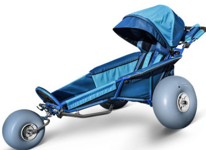
xROVER REHA BEACH

Versión deportiva para senderismo y actividades de ocio y deporte al aire libre