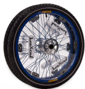
Protector de radios standard