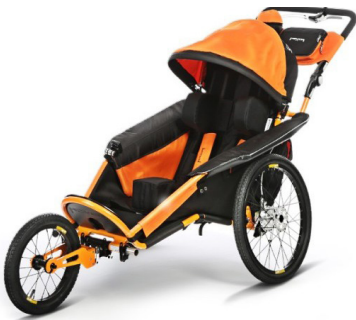
xROVER REHA ALL IN ONE

Versión básica para paseo y desplazamientos diarios