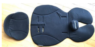
Kit de posicionamiento infantil