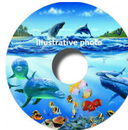
Protector de radios personalizable