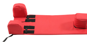
Kit de posicionamiento