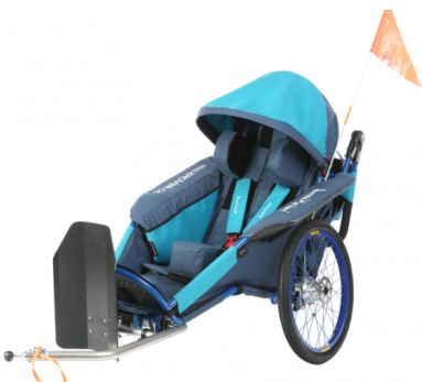
xROVER REHA BIKE TRAILER

Complemento para acceso a la playa y rodar por terrenos sueltos.