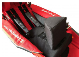
Cuña central oval