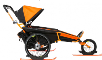
Set de Ski