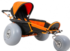
Set de Playa