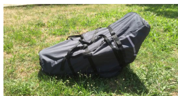
Bolsa de transporte