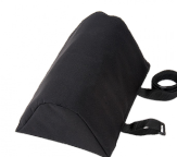
Almohadilla de rodilla