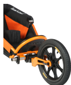
Jogging Set radios plástico