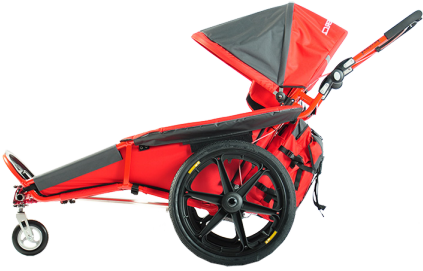
xROVER REHA STANDARD

Versión básica para paseo y desplazamientos diarios