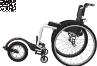
ICON 60 con TRACK WHEEL