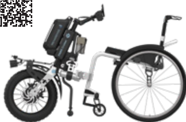
ICON 60 con PAWS