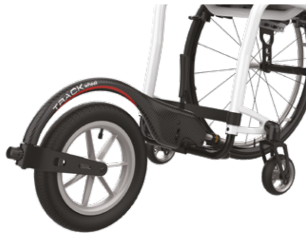
Garras traseras adicionales