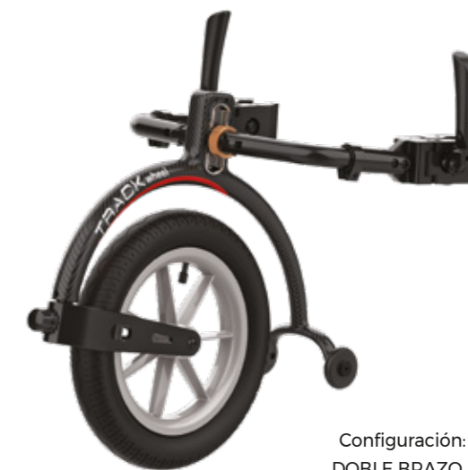
Configuración: DOBLE BRAZO, carbono

Gracias a la fibra de carbono ultraligera, la TRACK WHEEL DOBLE BRAZO pesa tan solo 4,40 kg con un tamaño de 12", lo que lo convierte en uno de los más ligeros del mercado. También está disponible en aluminio.