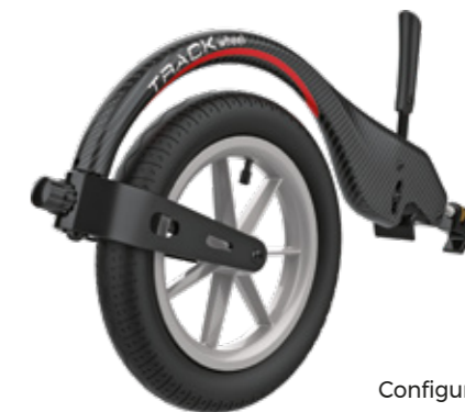
Configuración: BRAZO ÚNICO, carbono

LA TRACK WHEEL se fija a la plataforma rígida de la silla de ruedas y ofrece probablemente la mejor estabilidad direccional del mercado.