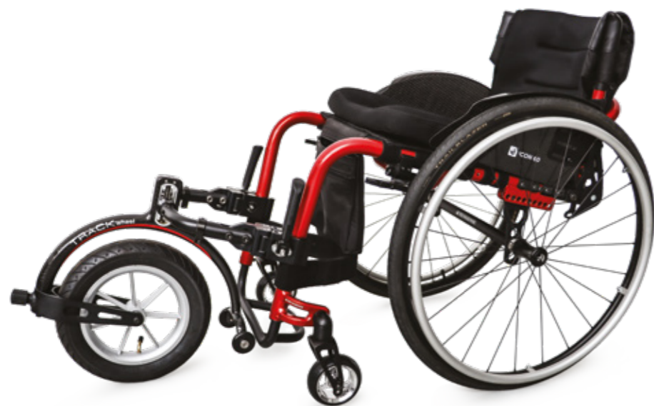
Configuración: Silla de ruedas activa ICON 60 con TRACK WHEEL DOBLE BRAZO, Carbono.

TRACK WHEEL está disponible en dos innovadoras soluciones de acoplamiento: BRAZO ÚNICO con un dispositivo de sujeción y DOBLE BRAZO con un dispositivo de sujeción doble. Una vez ajustada correctamente la TRACK WHEEL a su silla de ruedas, ¡se fija en segundos!