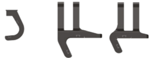
Garra delantera adicional

Su TRACK WHEEL BRAZO ÚNICO incluye un juego de garras adicional. El paquete incluye una garra adicional para la parte delantera y dos para la trasera.